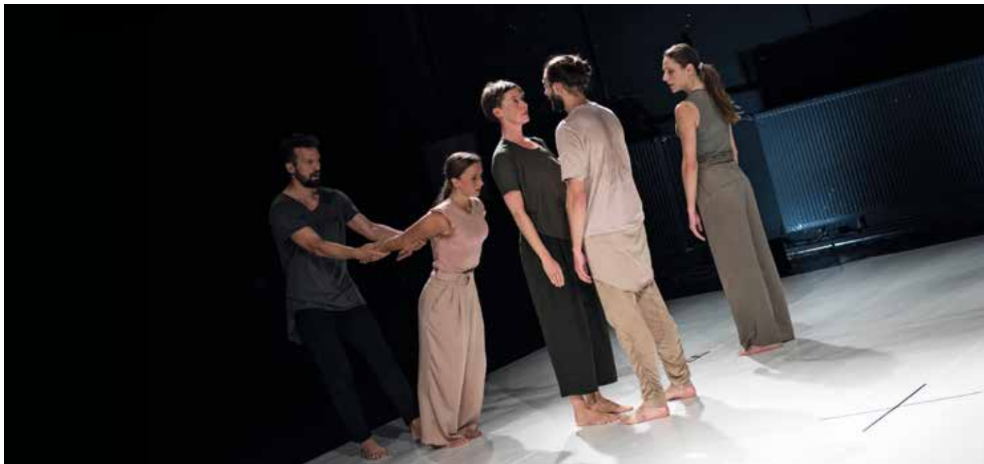
DADA VON BZDULOW / DZISIAJ WSZYSTKO

Od kilku lat staramy się zadbać o najmłodszą publiczność teatru tańca. W tym roku zaprosiliśmy ponownie hiszpański zespół Da.Te Danza, który dwa lata temu oczarował trójmiejską widownię spektaklem Rio De Luna . Tytuł najnowszej produkcji - Akari - oznacza po japońsku światło. Tancerzom udaje się wyrazić przez ruch to wewnętrzne światło, które w każdym z nas świeci w specjalny, unikalny sposób. (Cope Alcoy 28.05.2017)